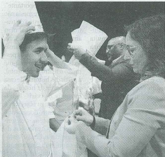
» Distintivos têm um significado especial

A Escola de Hotelaria de Fátima (EHF) procedeu à entrega dos distintivos aos alunos, no último dia 07. Um momento marcante que simboliza a passagem de testemunho entre os alunos finalistas e os mais novos, reforçando os valores de hierarquia, responsabilidade, união e excelência.